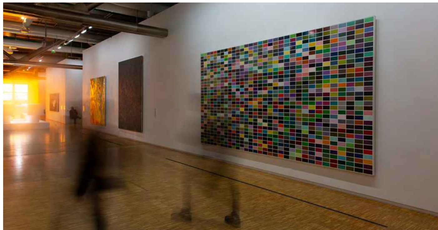
Vue d'une salle au niveau 4 du Centre Pompidou en septembre 2020. Au 1 er plan 1024 couleurs (350-3) de Gerhard Richter, 1973

Première collection d'art moderne et contemporain en Europe, le Centre Pompidou a développé, depuis son ouverture en 1977, une véritable expertise en matière de transmission des savoirs, adressée à tous les publics. En mettant en relation les pratiques artistiques contemporaines et l'actualité de la vie des idées, le Centre Pompidou est un espace d'échange et de débats où les savoirs et la création trouvent à dialoguer. Créée en mai 2018 avec la conviction que les artistes, grâce au regard qu'ils portent sur le monde, peuvent aider les entreprises à être plus agiles, notre offre de formation spécifiquement pensée pour elles favorise l'intelligence collective, sensible et relationnelle pour développer la curiosité, l'innovation, la créativité et l'ouverture d'esprit.