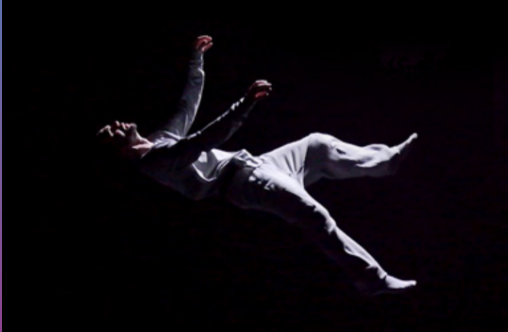
/Eon de la Cie 14:20, à l'ENS Paris-Saclay du 18 au 20 novembre 2021, organisé par la Scène de recherche-ENS Paris-Saclay, La Diagonale Université Paris-Saclay et la Biennale Nêmo