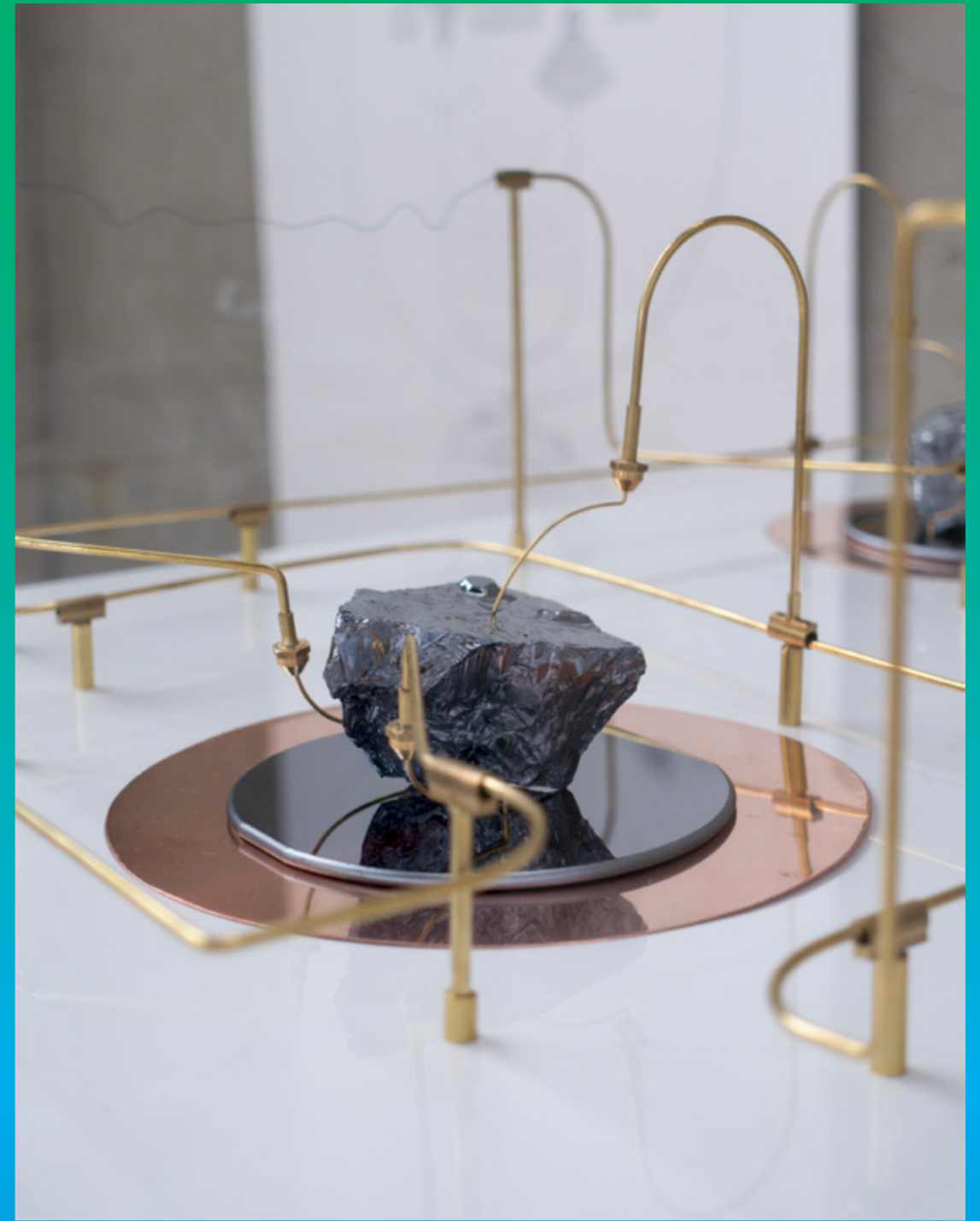
Paysages immatériels de Raphaëlle Kerbrat du 18 novembre au 17 décembre 2021 à l'ANAS, Evry-Courcouronnes