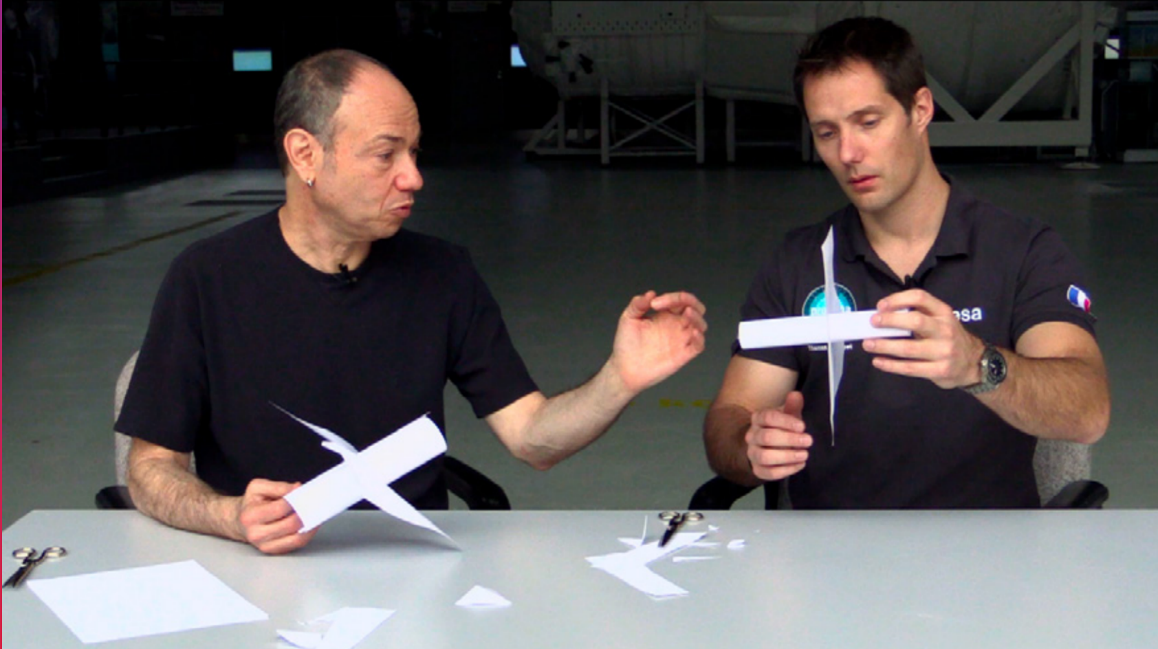
Télescope d'intérieur au musée des Arts et Métiers le 13 novembre