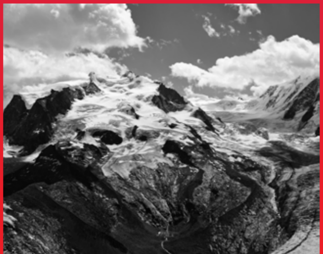
Cosa Mentale de David Munoz, présenté dans l'exposition Au-delà du Réel? au CENTQUATRE-PARIS du 9 octobre 2021 au 2 janvier 2022, et au Centre d'Art André Malraux, Le Bourget, du 14 octobre au 4 décembre 2021 ©David Munoz