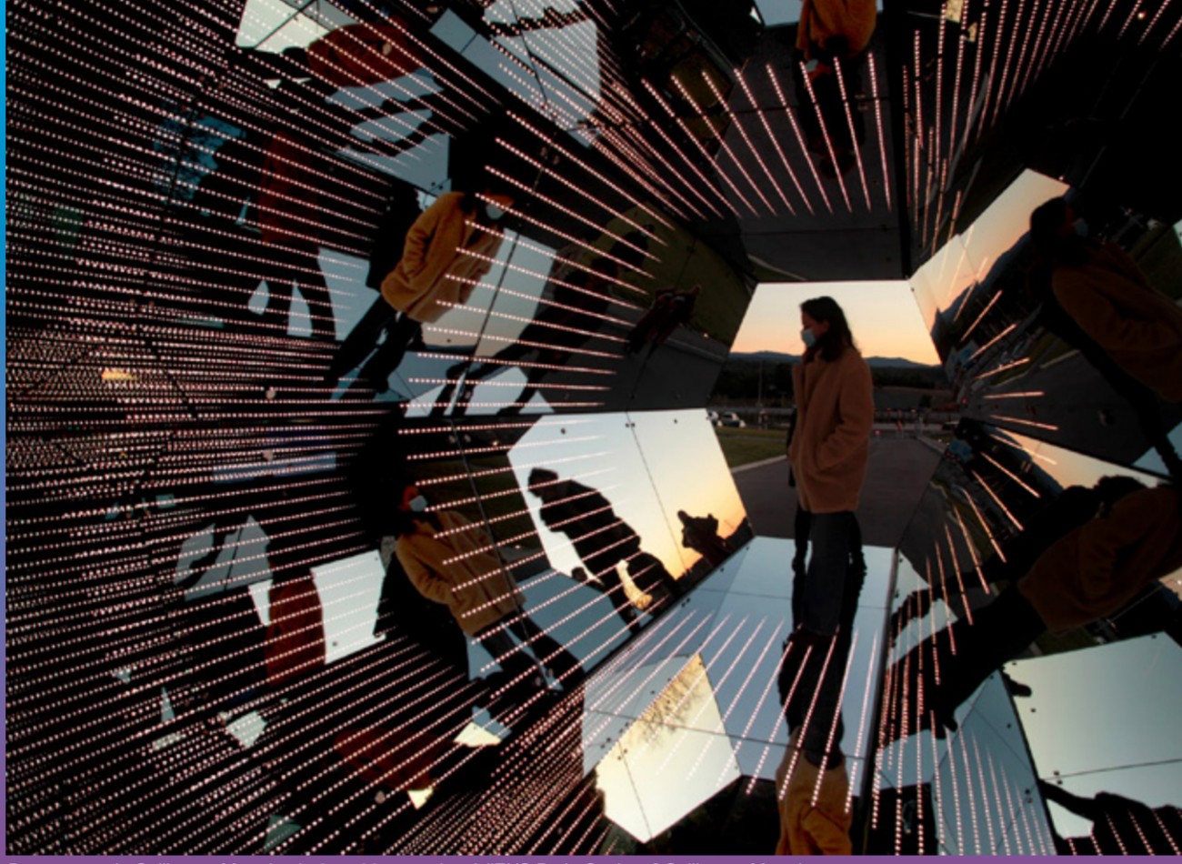
Passengers de Guillaume Marmin, du 9 au 22 novembre à l'ENS Paris-Saclay. ©Guillaume Marmin