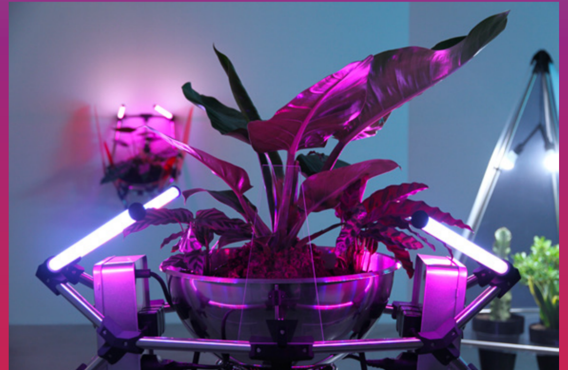
Rêve Quantique de Virgile Novarina, Walid Breidi et LABOFACTORY (Jean-Marc Chomaz et Laurent Karst) le 15 octobre à la Piscine d'en face et le 9 novembre à l'ENS Paris-Saclay et ©Marie-Sol Parant