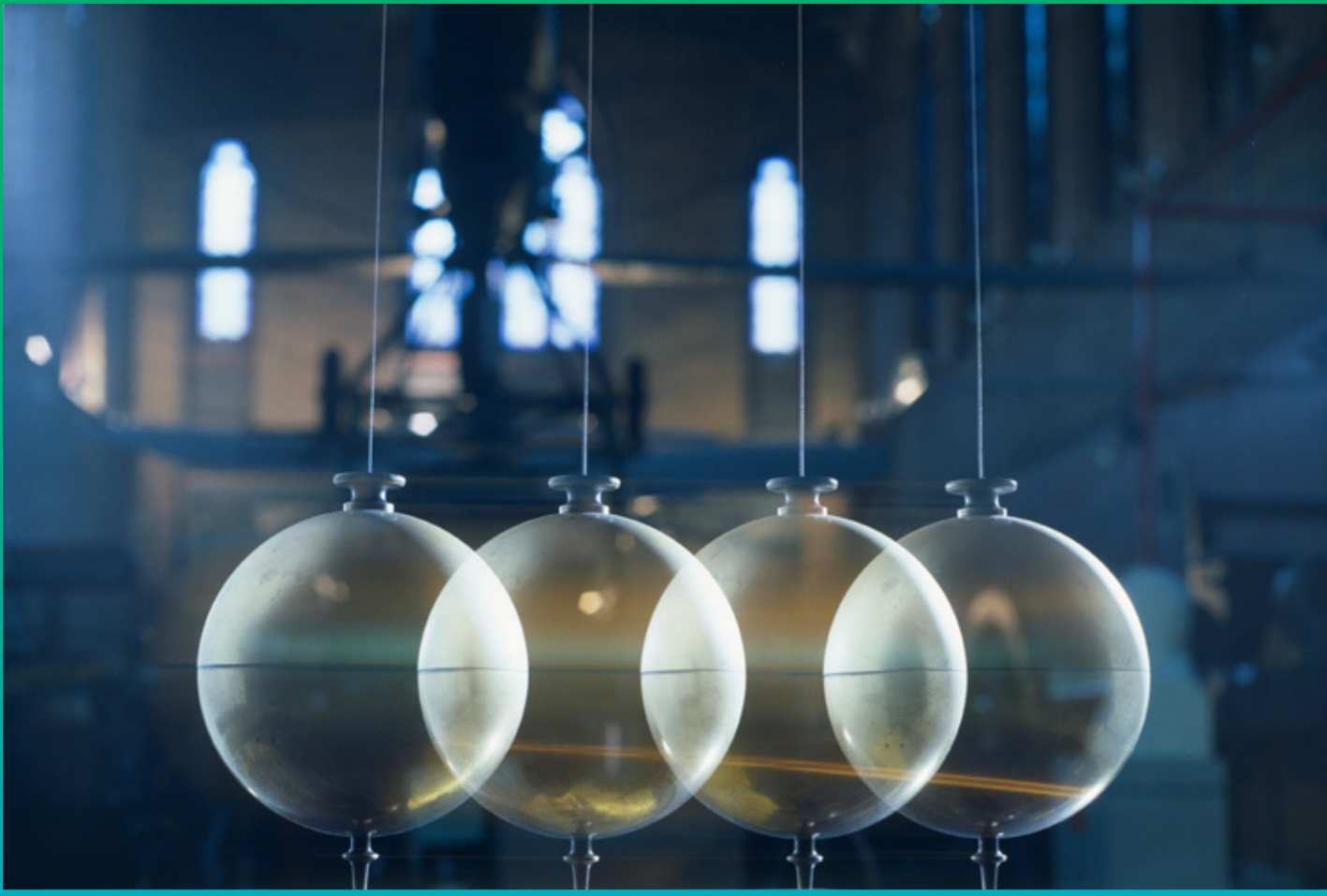
Le Pendule de Foucault, soirée Explorer l'invisible au musée des Arts et Métiers le 13 nov. de 18h30 à 22h30