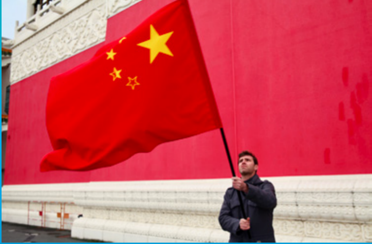
La Ligne Rouge de Filipe Vilas-Boas, du 9 novembre au 17 décembre 2021 à la Galerie Cesaria Evora, Evry ©Filipe Vilas-Boas