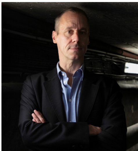
Thomas Clerc

L'écrivain Thomas Clerc vient à son tour effectuer une série de « toasts » divers. Il a investi avec brio le genre de la littérature d'intérieur. À l'image de son texte Intérieur paru chez L'Arbalète/Gallimard, qui décrit méthodiquement son appartement parisien, Thomas Clerc revient en cette rentrée littéraire avec un nouveau texte, Cave , qui continue d'arpenter son espace privé.