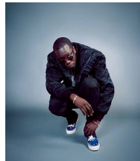
S.Pri Noir