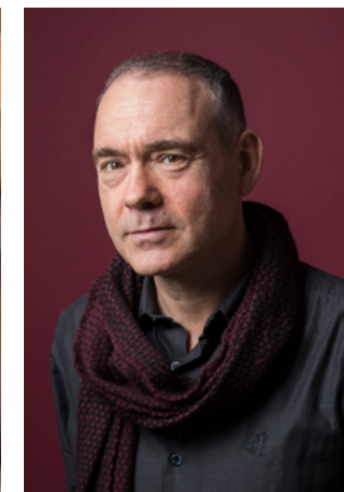
Christophe Boltanski