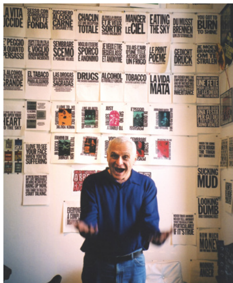
John Giorno

de nombreux « poem paintings ». En 1965, il fonde le label « Giorno Poetry Systems » qui a édité depuis une quarantaine d'albums. Son prix d'honneur s'inscrit dans une filiation forte et amicale avec le poète sonore Bernard Heidsieck, qui a largement œuvré pour sa reconnaissance en Europe puis aux États-Unis.