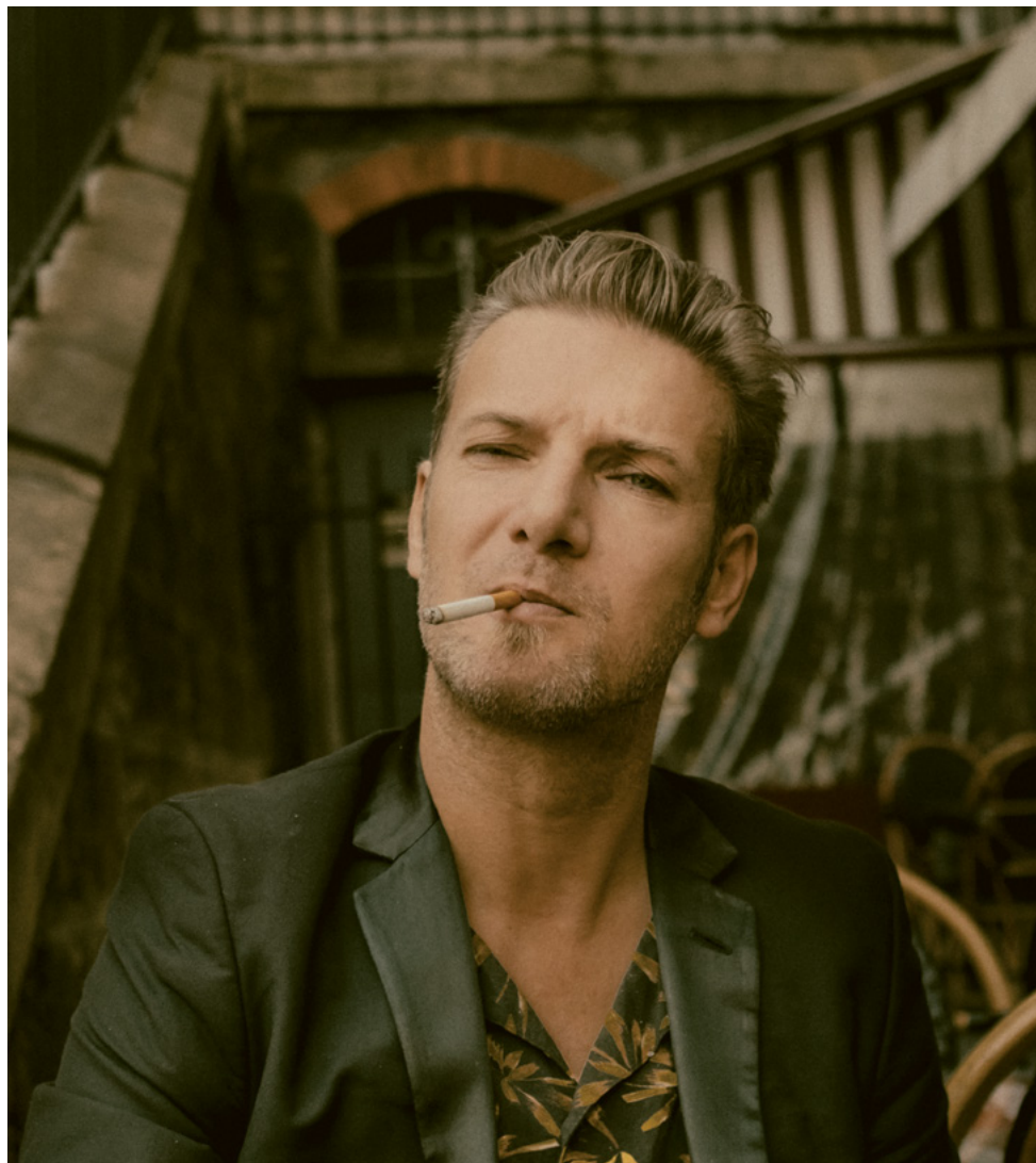
Bertrand Belin

Chanteur, musicien, écrivain, Bertrand Belin est invité à la Maison de la Poésie pour une soirée entre lecture et concert, autour de son dernier livre, Vrac (P.O.L, 2020), archipel de fragments, de poèmes, d'anecdotes et de pensées pour tenter de dire son enfance et ses origines. Avec cette carte blanche, le festival Extra! s'ouvre une fois encore aux écritures musicales, et aux harmonies croisées entre chanson et littérature.