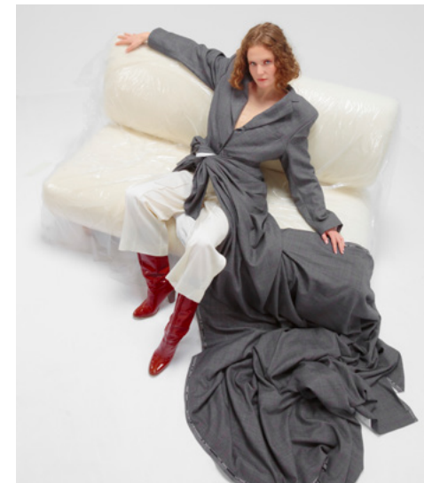
Brö, photo © Christopher Barraja